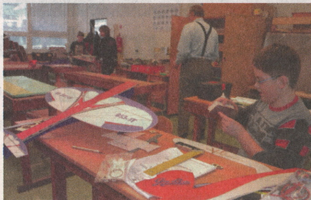
Mladí modelári zhotovujú lietadlá v dielni ZŠ na Hrnčiarskej ulici.